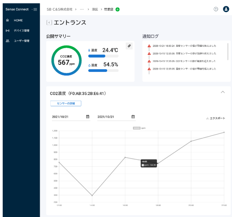
Sense Connect for 環境可視化 ダッシュボードのイメージ画面（各拠点）