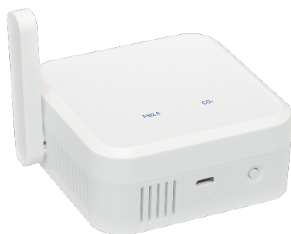
ラトックシステム社 環境センサー

CO2センサーには、スイス・センシリオン社製のCO2センサー「SCD40」を搭載した、国内メーカーであるラトックシステム社の環境センサーを使用しています。CO2センサー「SCD40」は、光音響検出原理を採用したPASens ® 技術で、コンパクトながら精度が高いCO2濃度の計測が行えるため、安心してご利用いただけます。