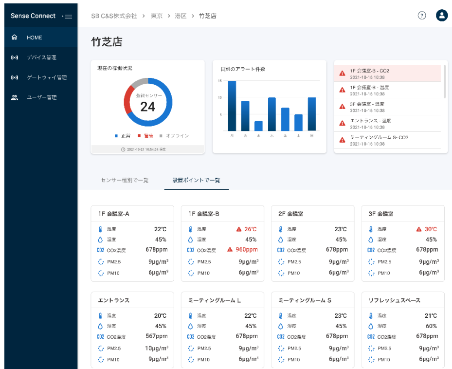
Sense Connect for 環境可視化 ダッシュボードのイメージ画面（複数拠点）