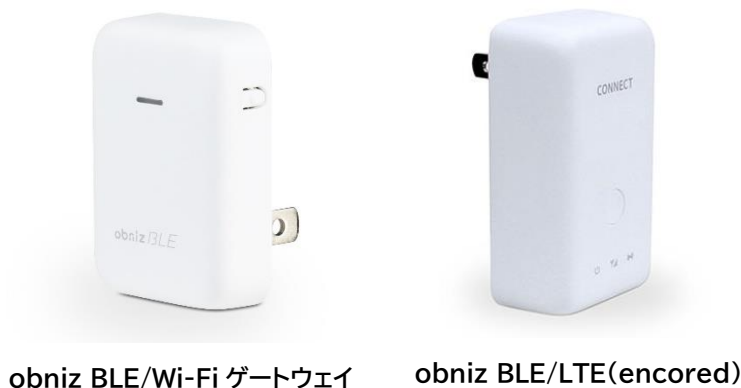
obniz BLE/Wi-Fi ゲートウェイ

電源とWi-Fi またはLTE環境があれば、コンセントに挿すだけでセットアップができるコンパクト型で、一般的なGWと比べて、1台あたりの価格は約2分の1に抑えながら、高い機能性を持ち合わせています。清潔感のあるカラーと小さなサイズで、どんな空間でも邪魔にならずに利用しやすいGWです。