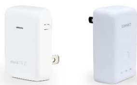
『obniz BLE ゲートウェイ』 シリーズ