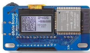
スリープ機能付き 『obniz Board 1Y』