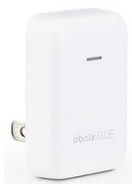
obniz BLE/Wi-Fi ゲートウェイ