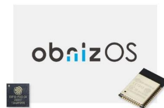
obnizOS (オブナイズ オーエス)