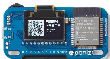
obniz Board (オブナイズ ボード)