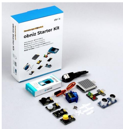
『obniz Board』と8種のパーツをセット 『obniz Board Starter Kit』

『obniz Board』は、株式会社 obniz 独自の技術を象徴する代表的製品です。