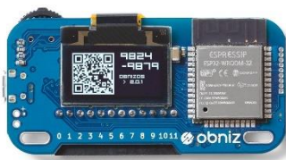
コントロールボード 『obniz Board』